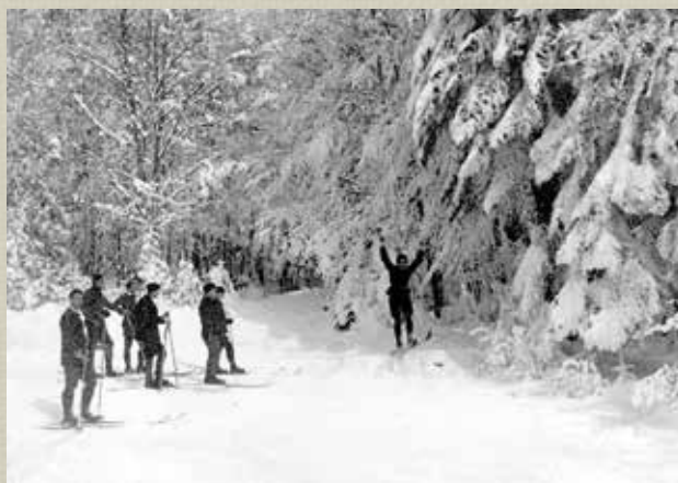
Sljeme - mala skakaonica za vježbu na Činovničkoj livadi